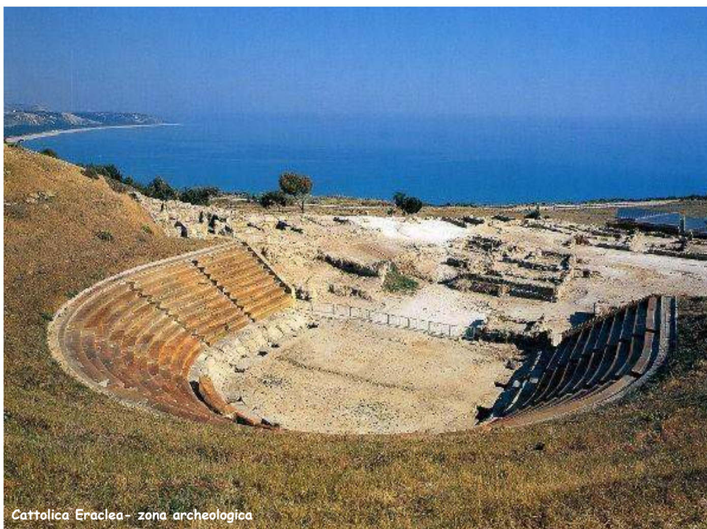
Cattolica Eraclea- zona archeologica