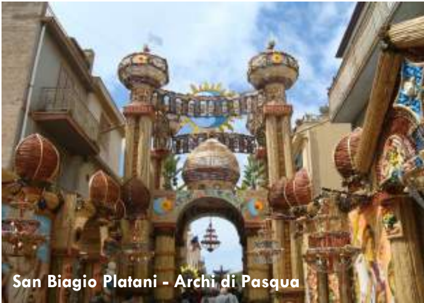
San Biagio Platani - Archi di Pasqua