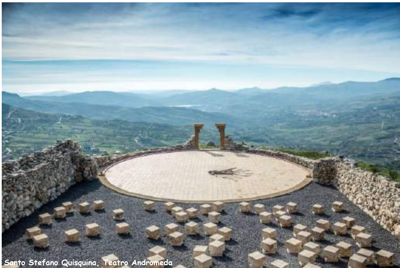
Santo Stefano Quisquina, Teatro Andromeda