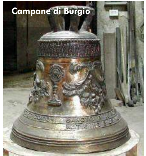
Campane di Burgio